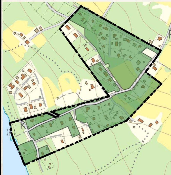
Planområdet avser grönmarkerat område i kartan. Ej markerat område tillhör detaljplan laga kraft 2016-10-27