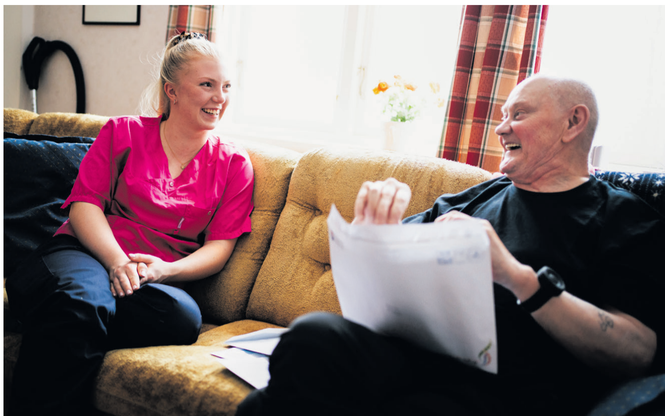
Det är en härlig stämning under besöket och det pratas om allt från OS till dagens väder.