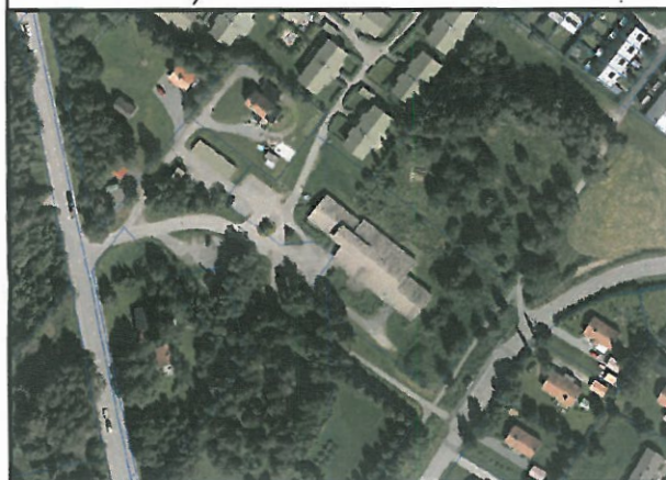
Flygbild över området